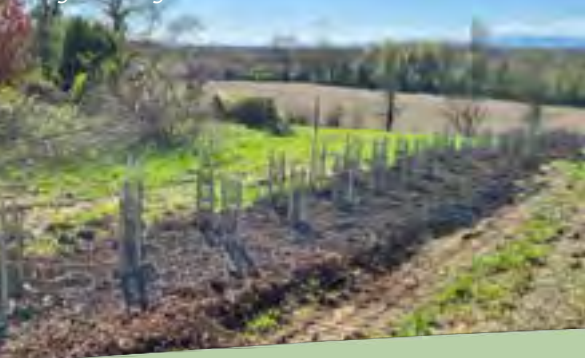
Figure 2 : Exemple d'une plantation de haie double rang à L'Abergement-Clémenciat en mars 2026

La plantation des haies peut se faire à partir de la période de repos végétatif, c'est-à-dire entre novembre et début mars.