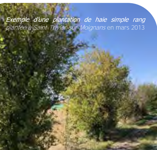
Exemple d'une plantation de haie simple rang plantée à Saint-Trivier-sur-Moignans en mars 2013