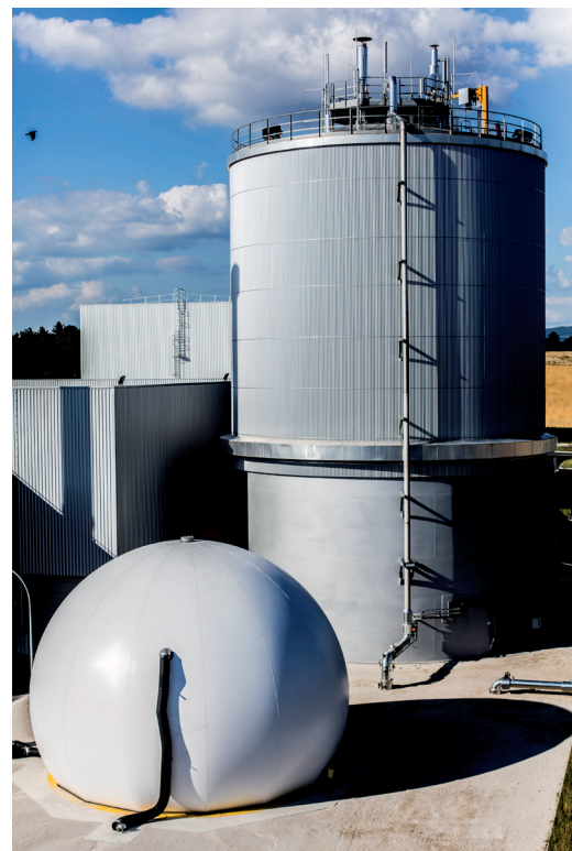
L'usine d'Organom valorise les ordures ménagères (ci-dessus le méthaniseur d'OVADE)

La communauté de communes assure la collecte des ordures ménagères sur son territoire. Elles sont ensuite acheminées par camion vers l'usine OVADE, située sur le site de La Tienne à Viriat. Les déchets subissent alors une première étape de tri, qui permet d'isoler les métaux ferreux recyclables et la matière organique méthanisable. Les refus (textiles sanitaires, plastiques, verre, inertes...) sont enfouis dans le centre de stockage attendant. La matière organique est ensuite digérée dans le méthaniseur, où elle produit du biogaz qui sera transformé en électricité. Enfin, ce qui reste après digestion, le digestat, est mélangé aux déchets verts (feuilles, branchages, tontes) pour produire du compost.