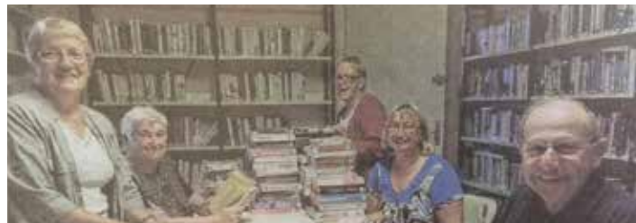
Les bénévoles de la bibliothèque, janvier 2015.

En avril 1988, Fernand Roux, maire, signe la 1 ère convention avec la bibliothèque du département (BDP). Les livres étaient stockés dans un placard de la salle du conseil.