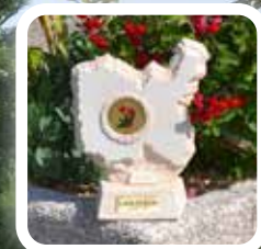
Trophée du fleurissement